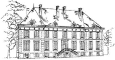
Château du Val de Mercy